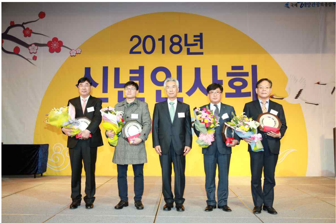
< 2018.1.3. 2018년 신년인사회 >