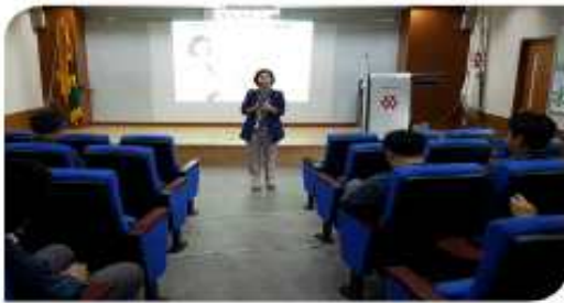
코오롱인더스트리 (2016. 10. 18)